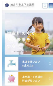
トップページ(スマホ版)