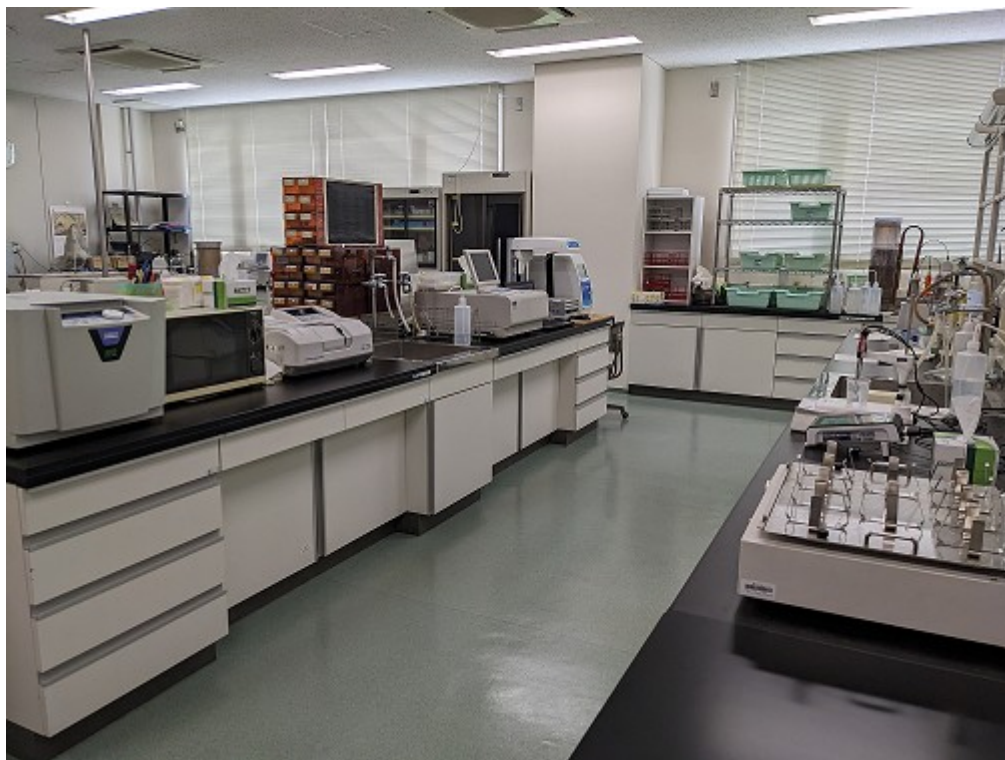
中西条浄水場 水質試験室