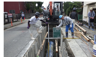
災害や老朽化に対応するため、計画的に管路の更新を進めています。