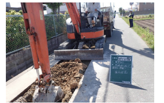
新たな整備手法も取り入れつつ工期の短縮を図っています。