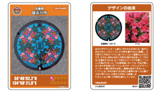
普段直接目にふれることのない下水道に関心をもっていただき、また下水道について広く知ってもらうため、啓発グッズの配布を行っています。