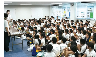
市内小学校や町内会、高齢者大学などを対象に、水道水ができるまでの過程について中西条浄水場での見学会を実施しています。