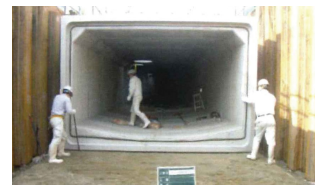
近年は短時間での局地的豪雨が頻繁に発生するなど、浸水被害のリスクが高まっており、様々な対策を行っています。